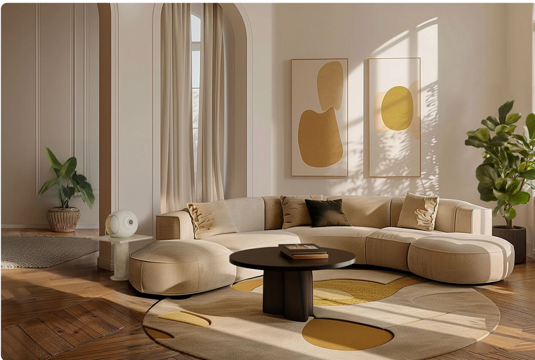
▲ Devialet Phantom Ultimate

Na ruim een jaar bewijst The New Sound dat hun rebelse aanpak op audio werkt. Waar veel merken zich nog richten op de 1% audiofielen, spreekt The New Sound juist de 99% aan. Dit zijn de mensen die dagelijks van muziek genieten via streaming, vinyl of festivals, maar voor wie de wereld van goede apparatuur vaak ingewikkeld is gemaakt