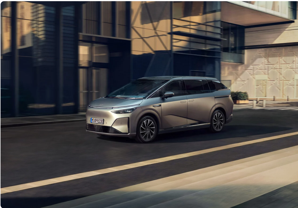
▲ XPENG X9

München/Wien, 8. Mai 2026 – Vorhang auf für den neuen XPENG X9 (Energieverbrauch kombiniert 20,0-20,8 kWh/100 km; CO 2 -Emissionen kombiniert: 0 g/km; CO 2 -Klasse: A. Werte vorbehaltlich abschließender Homologation): Das vollelektrische Van-Flaggschiff erweitert die Modellpalette der chinesischen Hightech-Marke. Das siebensitzige MPV, das bereits im Online-Konfigurator verfügbar ist, startet zu Preisen ab 78.600 Euro (UVP inkl. 20% MwSt.) in Österreich. Bestellungen sind ab sofort bei den teilnehmenden XPENG Vertragspartnern möglich, die ersten Fahrzeuge rollen ab Juni zu den Kunden.