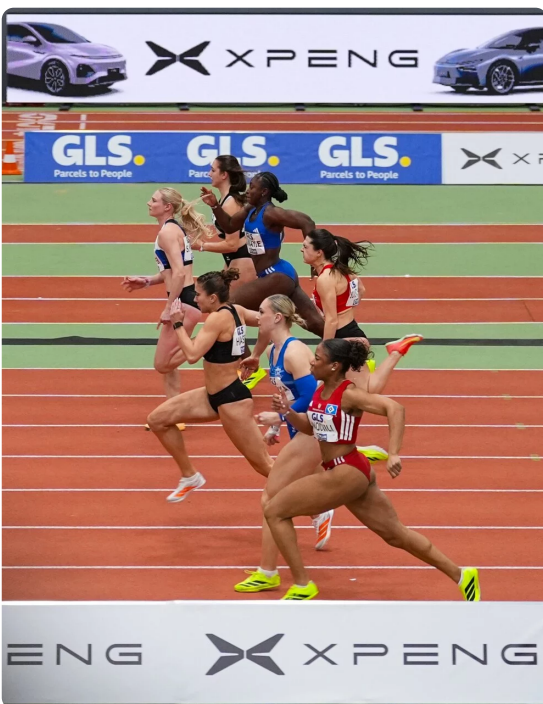
▲ Internationale Leichtathletik-Elite in Ratingen: XPENG macht Mehrkampf-Meeting mobil

München, 25. Juni 2026 – Wenn die internationale Leichtathletik-Elite nach Deutschland kommt, darf XPENG nicht fehlen: Als neuer Mobilitätspartner des Deutschen Leichtathletik-Verbands (DLV) begleitet und unterstützt die Hightech-Marke das Mehrkampf-Meeting im nordrhein-westfälischen Ratingen bei Düsseldorf (27. und 28. Juni 2026). Das vom DLV organisierte Event gilt als wichtige Standortbestimmung für die Zehn- und Siebenkämpfer vor den Europameisterschaften. Erwartet werden Weltmeister, Rekordhalter und Olympiasieger.