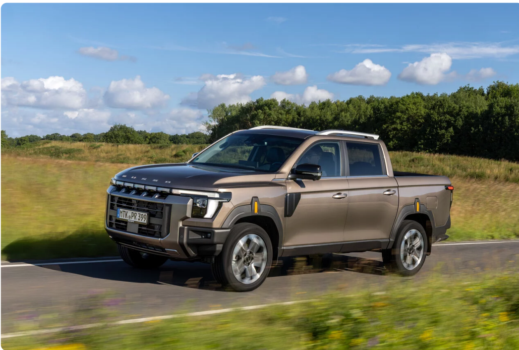
▲ KGM Musso

Der KGM Musso geht in die nächste Runde: Der vielseitige Pick-up ist ab sofort mit geschärftem Design, mehr Komfort und verbesserten Offroad-Eigenschaften erhältlich. Unverändert bleiben die zwei verfügbaren Längen, die großzügigen Ladekapazitäten und bis zu 3,5 Tonnen Anhängelast. Der neue KGM Musso startet zu Preisen ab 40.990 Euro, der Musso Grand bei 42.490 Euro (jeweils UVP inkl. 19% MwSt.).