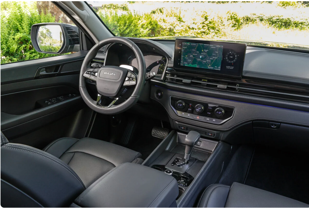
▲ KGM Musso

Zum Serienumfang gehören außerdem elektrisch anklappbare Außenspiegel, eine Klimaanlage, Licht- und Regensensor, ein automatisch abblendender Innenspiegel, Einparkhilfen vorne und hinten sowie eine Rückfahrkamera. Für Sicherheit sorgen unter anderem der automatische Notbremsassistent, ein Spurhalte- und ein Fernlichtassistent, eine Müdigkeitserkennung sowie sechs Airbags.