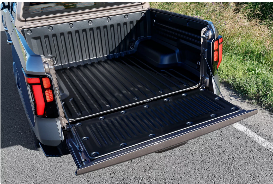
▲ KGM Musso

An die serienmäßige Doppelkabine, die viel Platz für bis zu fünf Personen bietet, schließt sich eine 1,30 Meter (Musso) bzw. 1,61 Meter (Musso Grand) lange Pritsche an. Sie bietet ein Ladevolumen von bis zu 1.262 Litern und bis zu 700 Kilogramm Nutzlast, die maximale Zuladung beträgt 1.085 Kilogramm (je nach Modell und Ausstattung). Die links und rechts in die hintere Stoßstange integrierten Trittstufen vereinfachen den Zugang zur Pritsche. Acht statt vormals vier Verzurrösen ermöglichen eine noch bessere Ladungssicherung, eine LED-Laderaumbeleuchtung bringt Licht ins Dunkel.