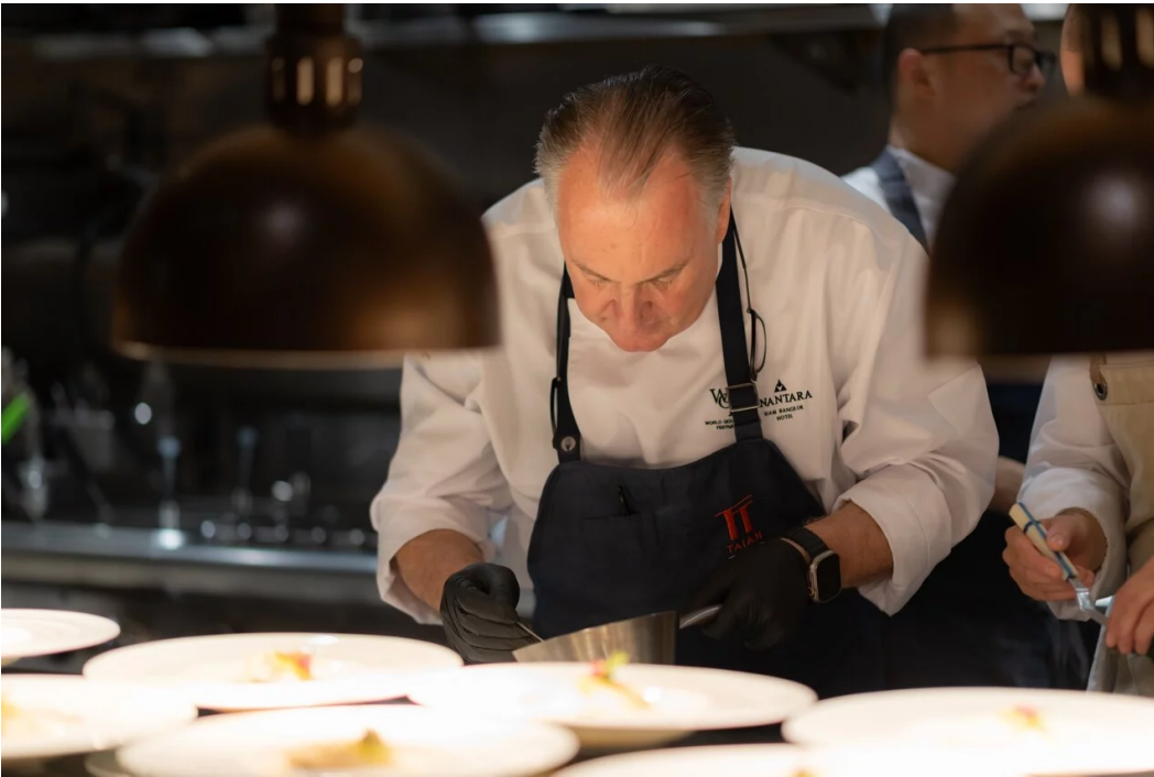
▲ World Gourmet Festival

เทศกาลอาหารระดับนานาชาติที่นักชิมตั้งตารอคอย World Gourmet Festival เตรียมกลับมาสร้างสีสันอีกครั้ง ณ โรงแรมอนันตรา สยาม กรุงเทพฯ (Anantara Siam Bangkok Hotel) ในระหว่างวันที่ 29 กันยายน – 4 ตุลาคม 2569 ภายใต้ธีม “The World of Flavours” เพื่อชวนทุกคนออกเดินทางผ่านรสชาติจากทั่วทุกมุมโลก