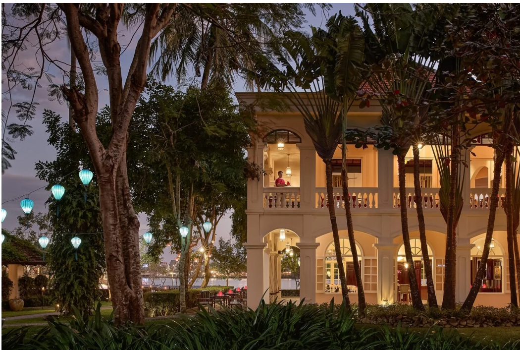
▲ Anantara Hoi An Resort

โรงแรมในเครือ 10 แห่ง ครอบคลุมทั้งเอเชีย ยุโรป แอฟริกา ตะวันออกกลาง และอเมริกาใต้ ได้รับการยกย่องให้ติดอันดับรายชื่อโรงแรมที่ดีที่สุดในโลก