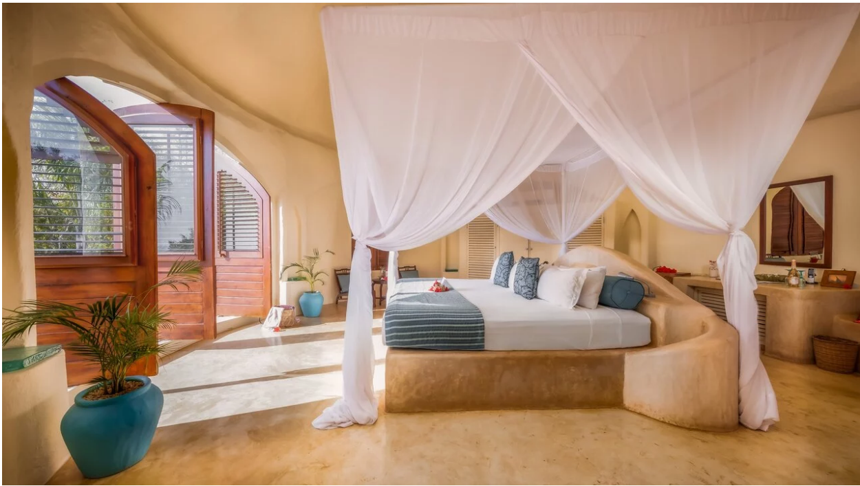
▲ Kilindi Zanzibar

สำหรับภูมิภาคแอฟริกาและตะวันออกกลาง อนันตรา เดอะ ปาล์ม ดูไบ รีสอร์ท (Anantara The Palm Dubai Resort) ซึ่งมีชื่อเสียงจากการออกแบบที่ได้รับแรงบันดาลใจจากสไตล์ไทย และเป็นรีสอร์ทแห่งแรกในดูไบที่มีวิลล่าเหนือน้ำ ได้รับการยกย่องจากการมอบความผ่อนคลายสไตล์รีสอร์ทในใจกลางมหานครระดับโลก ขณะที่ คิลินดี แซนซิบาร์ (Kilindi Zanzibar) ภายใต้เครือเอเลวาน่า คอลเลคชั่น (Elewana Collection) ได้รับการยอมรับจากสถาปัตยกรรมพาวิลเลียนส์ ชาวอันเป็นเอกลักษณ์ และมีชื่อเสียงในฐานะหนึ่งในบูทีครีสอร์ทที่โรแมนติกที่สุดแห่งหนึ่งของแอฟริกาตะวันออก ส่วนในทวีปอเมริกาใต้ โรงแรม ทิวาลี โมฟาร์เรจ เซาเปาโล (Tivoli Mofarrej São Paulo Hotel) ยังคงเป็นหนึ่งในโรงแรมหรูใจกลางเมืองชั้นนำของประเทศบราซิล