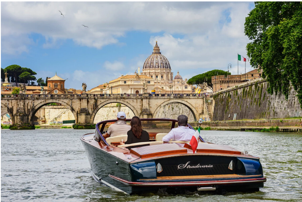
▲ River & Rooftop Escape, Signature Anniversary Experience offered by Anantara Palazzo Naiadi Rome

เนื่องในโอกาสครบรอบ 25 ปี อนันตรา โฮเทลส์ แอนด์ รีสอร์ทส์ เชิญชวนนักเดินทางสัมผัสโลกในมุมมองใหม่ ผ่านประสบการณ์การเดินทางที่รังสรรค์ขึ้นอย่างพิถีพิถัน ครอบคลุมเมืองใหญ่ ธรรมชาติ และวัฒนธรรมอันเป็นเอกลักษณ์