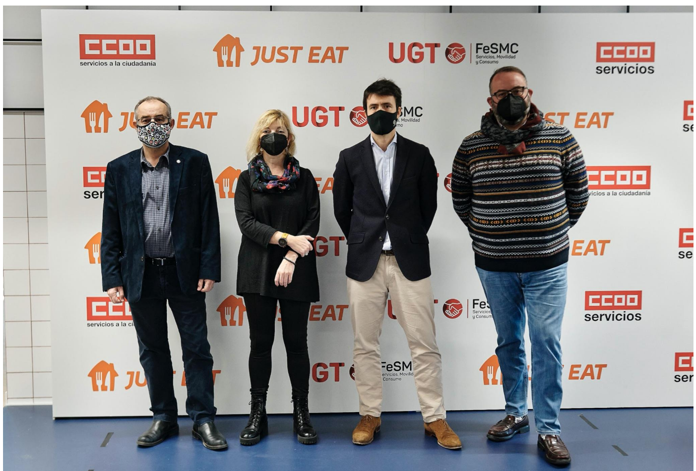
Rueda de prensa Convenio Colectivo de Empresa con UGT y CCOO, diciembre de 2021

Igualmente, desde Just Eat apoyamos la nueva directiva de Trabajo en Plataformas Digitales actualmente en debate en las instituciones europeas.