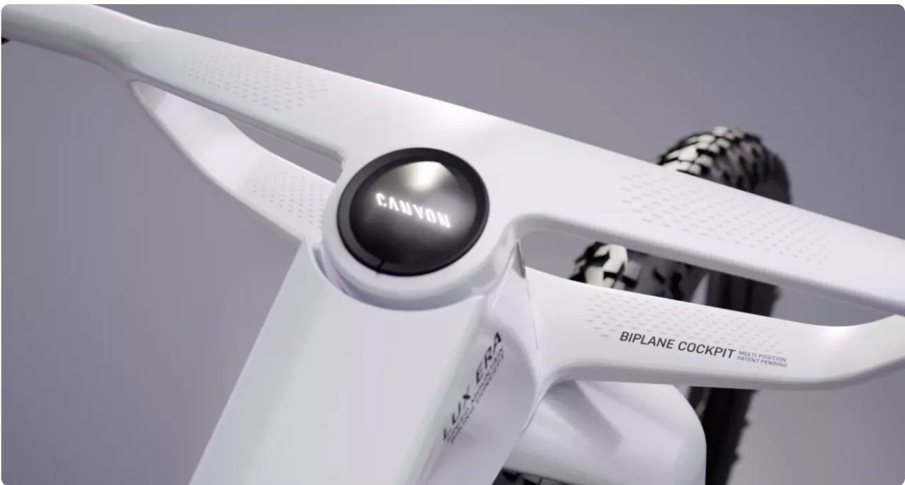
▲ Lux Era computer