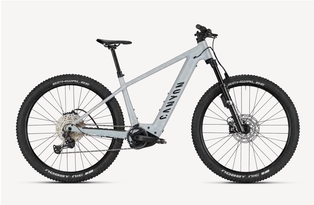
MODELL Grand Canyon:ON AL 9 FARBE P05 (Eis am Stiel)