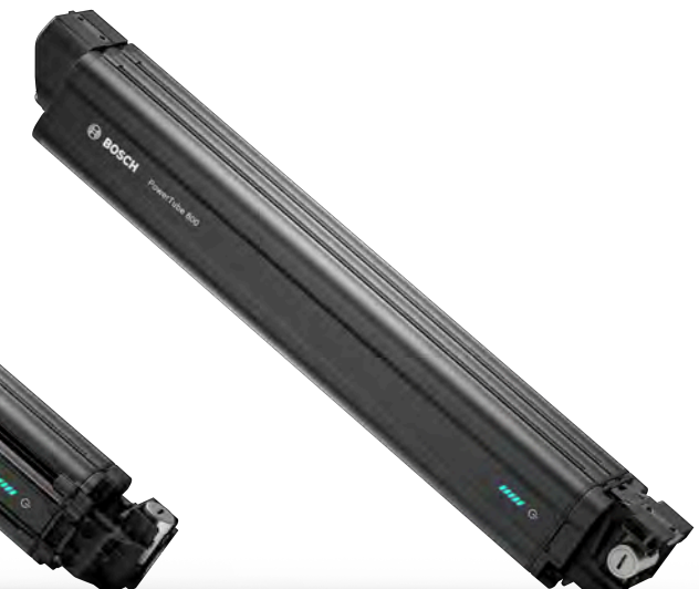
Bosch PowerTube 800 Wh Batterie