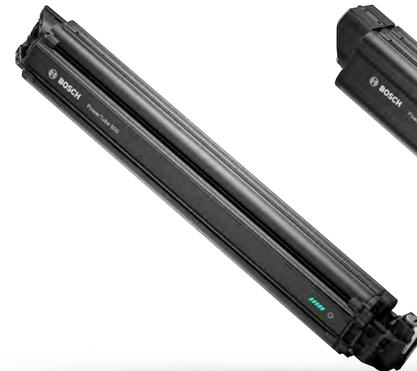
Bosch PowerTube 600 Wh Batterie