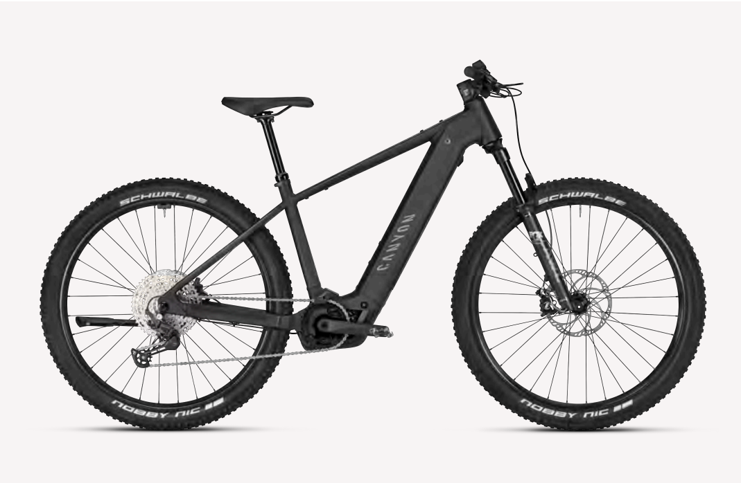
MODELL Grand Canyon:ON AL 8 FARBE P01 (Stealth Black) P02 (Glacier)