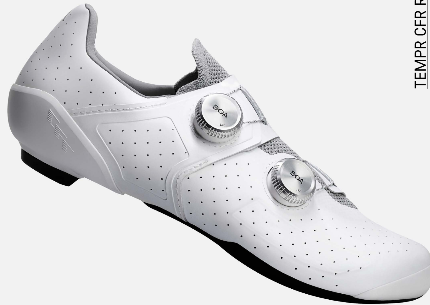
TEMPR CFR ROAD

Rennradschuhe auf Pro-Niveau: Steife Carbonsohle, komfortable Stretch-Zonen und eine perfekte Verbindung zum Bike - für eine ultimative Kraftübertragung auf den schnellsten Fahrten..