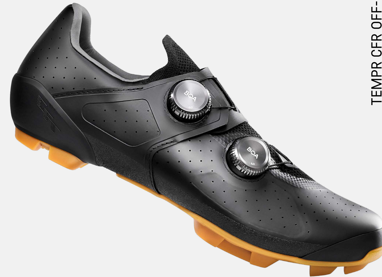
TEMPR CFR OFF-ROAD

Rennradschuhe auf Pro-Niveau: Steife Carbonsohle, komfortable Stretch-Zonen und eine perfekte Verbindung zum Bike - für eine ultimative Kraftübertragung auf den schnellsten Fahrten..