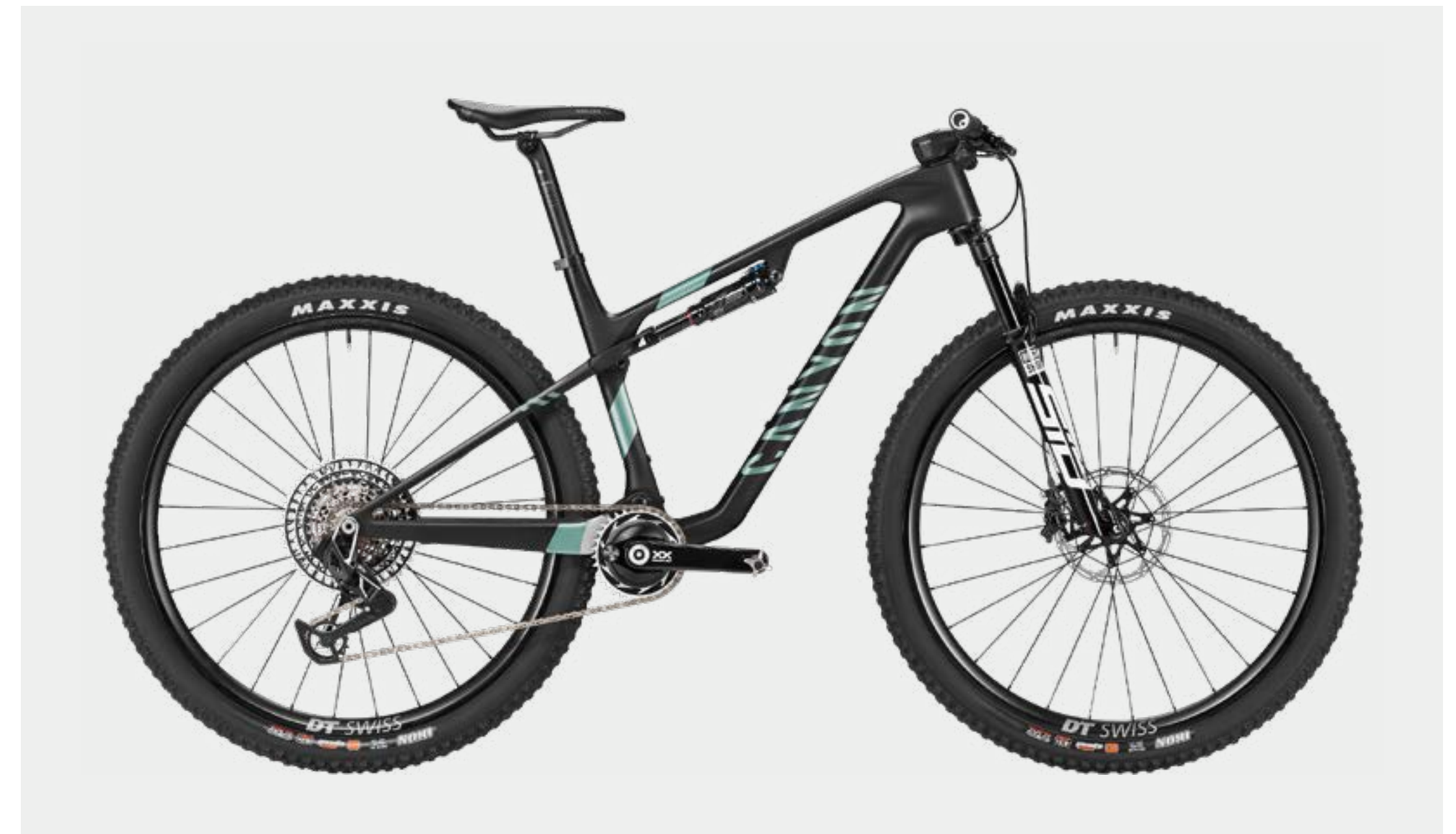
LUX WORLD CUP CFR LTD • CFR GREEN