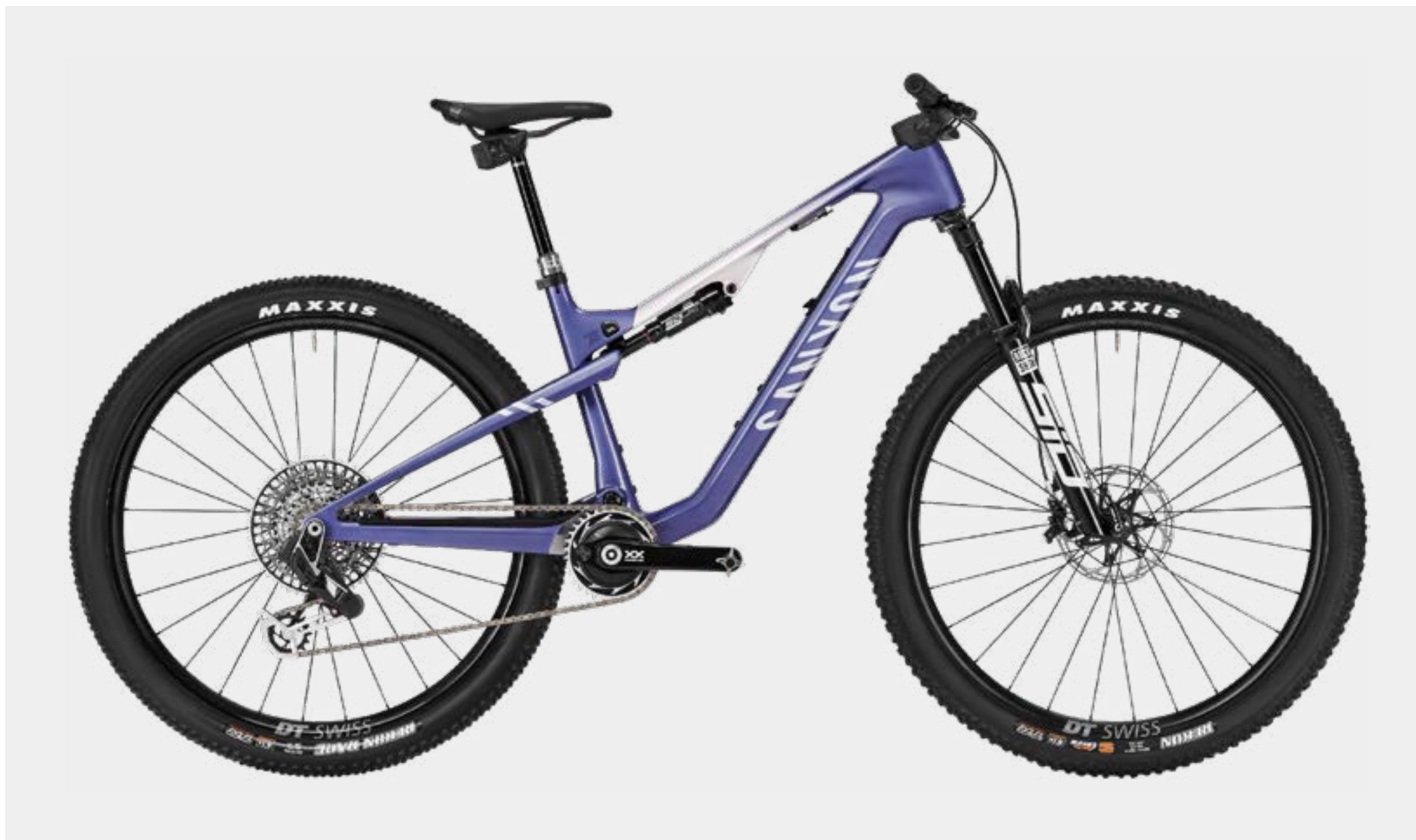
LUX TRAIL CFR LTD • LIGHTNING MAUVE

Der CF Rahmen enthält die gleiche Essenz, die das CFR so leistungsfähig macht und kommt in einem preislich attraktiven Paket, das perfekt auf die Bedürfnisse anspruchsvoller Hobby- und Freizeit-Sportler zugeschnitten ist. Das CF 9 ist mit RockShox- und SRAM Komponenten ausgestattet, während für das CF 8 , CF 7 und CF 6 eine Palette von FOX- und Shimano Komponenten zur Auswahl steht.