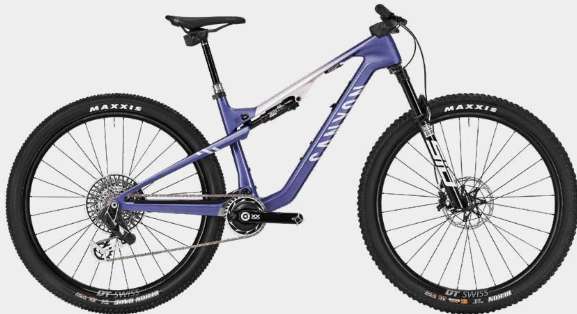
LUX TRAIL CFR LTD • LIGHTNING MAUVE

Das LUX TRAIL ist ein komplett neues Bike mit einem grundlegenden Redesign. Es basiert auf der DNA unseres rennerprobten LUX WORLD CUP . Während es beim LUX WORLD CUP um die Jagd nach Siegen auf dem Racetrack geht, ist das LUX TRAIL für die Jagd nach persönlichen Rekorden jenseits des Tapes gemacht.