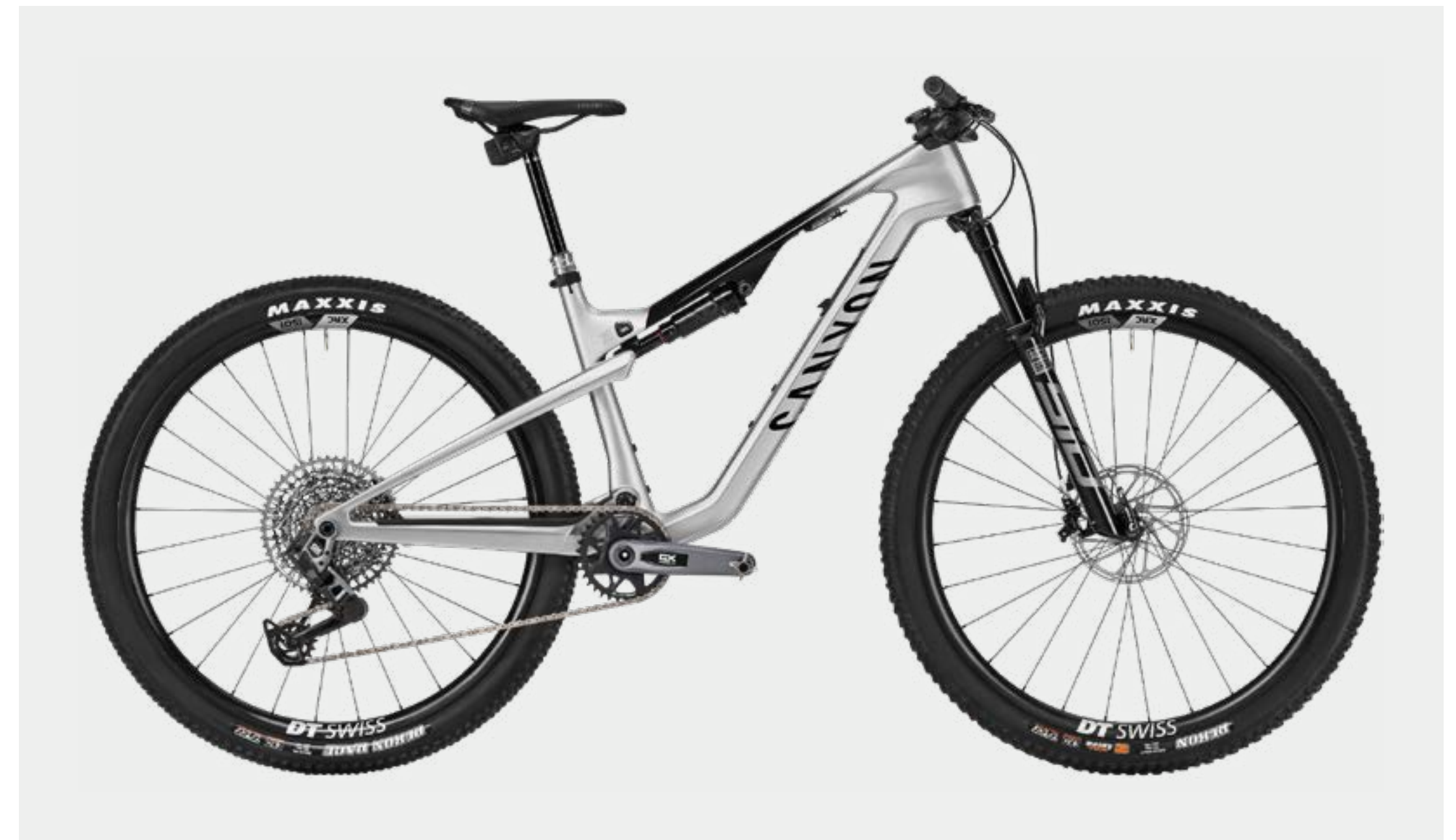
LUX TRAIL CF 9 • CHROME LEVEL 1