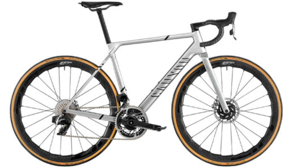
ULTIMATE CFR ETAP