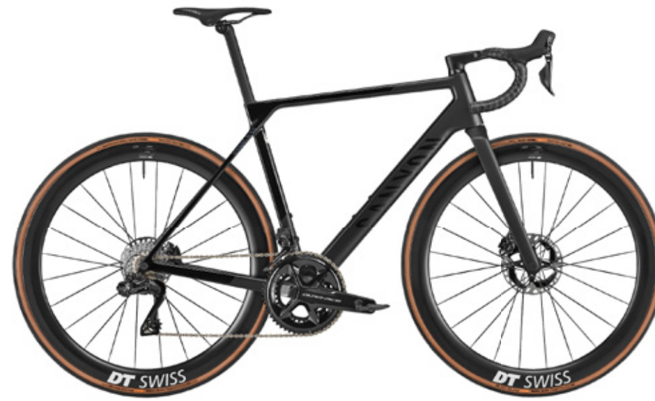
ULTIMATE CF SLX 9 DI2