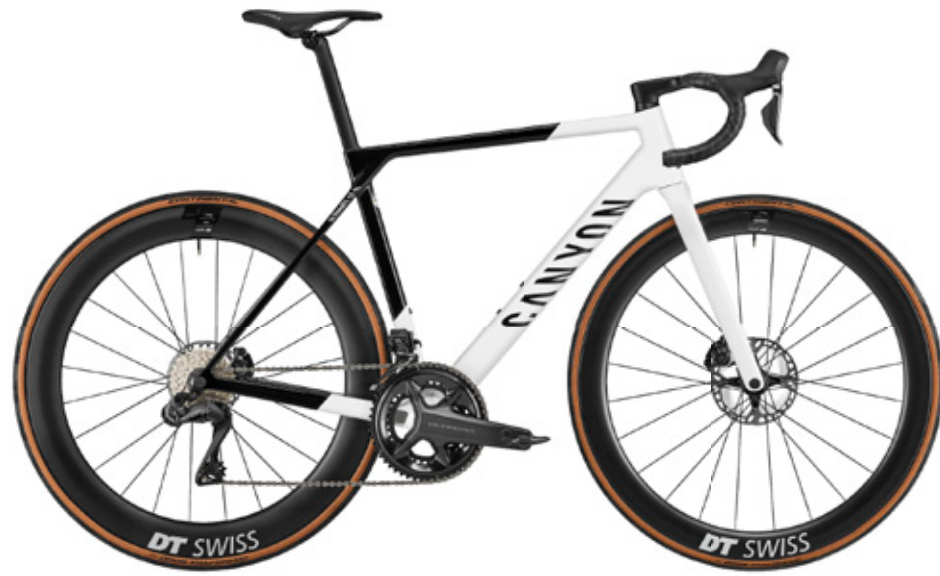
ULTIMATE CF SL 8 AERO