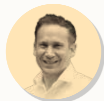
Directeur eCommerce SPAR

Le Nocturnal Living montre à quel point les habitudes des gens sont en pleine mutation. Elle souligne aussi qu'une tendance se développe rarement seule. Grâce au succès du concept de Midnyt, d'autres commerces d'alimentation ont compris qu'il existait un besoin de livraison à la demande. Cela a conduit à des partenariats avec des entreprises de renommée internationale, comme SPAR, qui proposent leur assortiment pendant la journée et s'adressent ainsi à des personnes souhaitant organiser leur quotidien le plus efficacement possible. Sur d'autres marchés de Just Eat, comme l'Allemagne et le Royaume-Uni, la livraison à la demande fait déjà partie intégrante du comportement de commande de nos clients. Nous allons maintenant voir comment ces tendances entraînent également une augmentation des commandes pendant les heures creuses en Suisse.