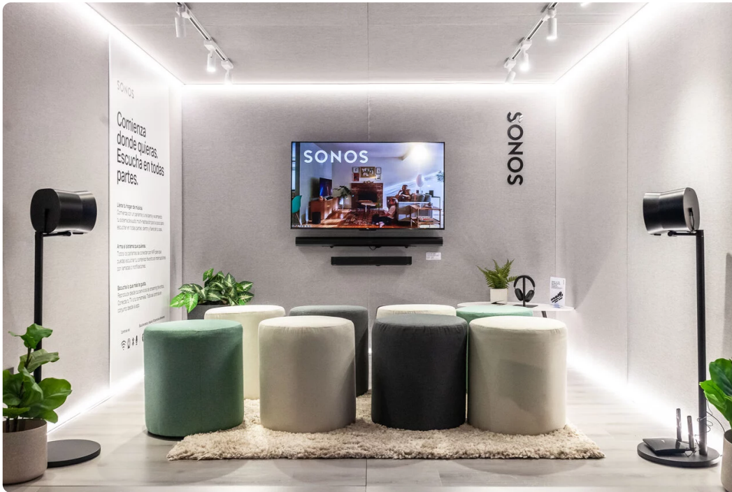
▲ El sonido de la pop-up store de Sonos llega a Falabella Parque Arauco