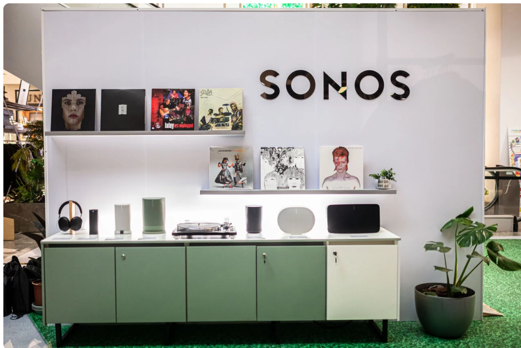
▲ El sonido de la pop-up store de Sonos llega a Falabella Parque Arauco

sistema y plantear sus necesidades e inquietudes. Para agradecer su interés, Sonos y Falabella ofrecen un descuento especial del 5% para quienes participen en esta actividad, vigente del martes 26 de mayo al lunes 8 de junio.