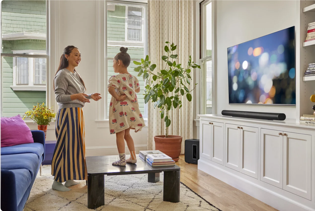
▲ Sonos Arc Ultra