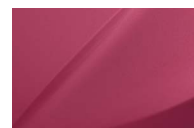
Techno Magenta (Metallic)