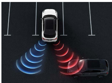
Varning för korsande trafik bakom (RCTA)