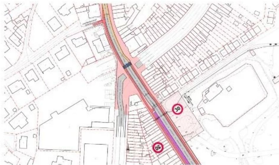
▲ Kruispunt Kanon

Het is de bedoeling om fiets- en voetpaden meer te laten aansluiten op het Park Blauwe Poort. Ter hoogte van de hoeve Blauwe Poort is er ook de mogelijkheid om een poorteffect te creëren bij het binnenrijden van de stad. Dit zorgt voor een snelheidsverlagend effect bij de overgang naar gemengd verkeer.