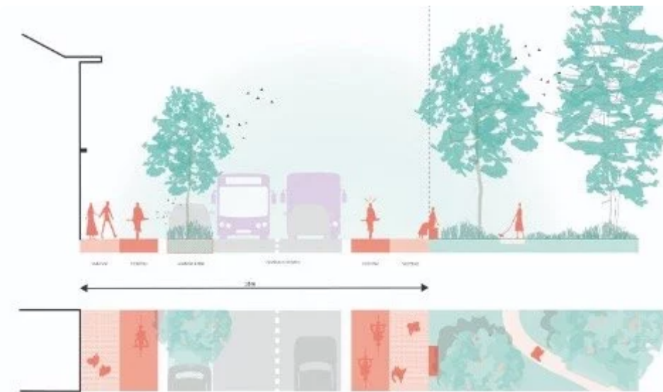
▲ Het voorziene wegprofiel naast het Blauwe Poortpark.

Het is de bedoeling om fiets- en voetpaden meer te laten aansluiten op het Park Blauwe Poort. Ter hoogte van de hoeve Blauwe Poort is er ook de mogelijkheid om een poorteffect te creëren bij het binnenrijden van de stad. Dit zorgt voor een snelheidsverlagend effect bij de overgang naar gemengd verkeer.