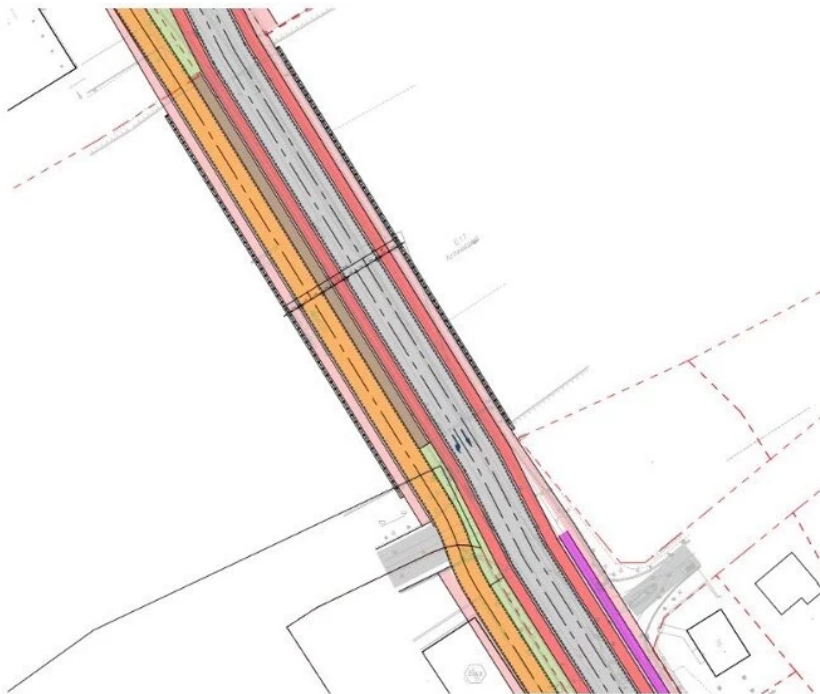
▲ Brug over E17

Het kruispunt met de R8 blijft werken met verkeerslichten maar zal ook hier afgescheiden fietspaden hebben. Bovendien zal de voormalige reservatiestrook ingericht worden als groene as met recreatieve functie en ruimte voor fietsverbindingen.