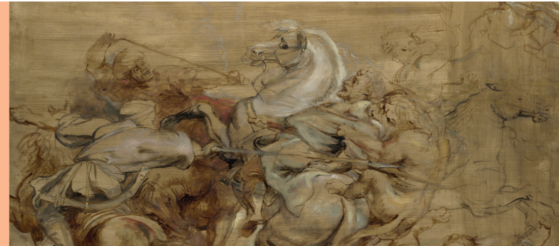
Peter Paul Rubens, Leeuwenjacht, The Lion Hunt, c. 1615, olieverf op paneel, oil on panel. London, The National Gallery.

There will be live performances in the exhibition between midday and 3.00 p.m. every Saturday and Sunday and on weekdays during the autumn half-term and Christmas holidays. For the full programme visit boijmans.nl/rubens