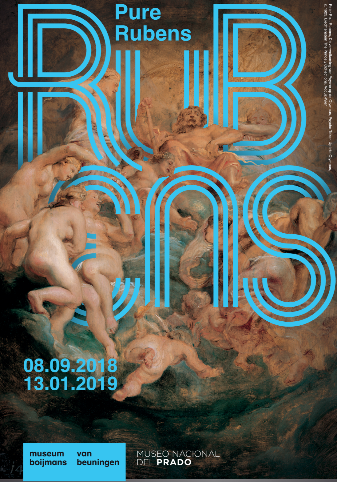
Peter Paul Rubens, De verwekking van Perseus op de Olympus, Perseus Taken Up into Olympus, c. 1638, Leidensteinen The Pinacoth Collections, Votiv-Wien

The museum is easily accessible via public transport: The museum is a 15-minute walk from the Central Station. Tram 7 stops outside the museum (Museumpark stop) or you can take the metro to Eendrachtspolein. There is plenty of space in the Museumpark car park. The museum is accessible for wheelchair users.