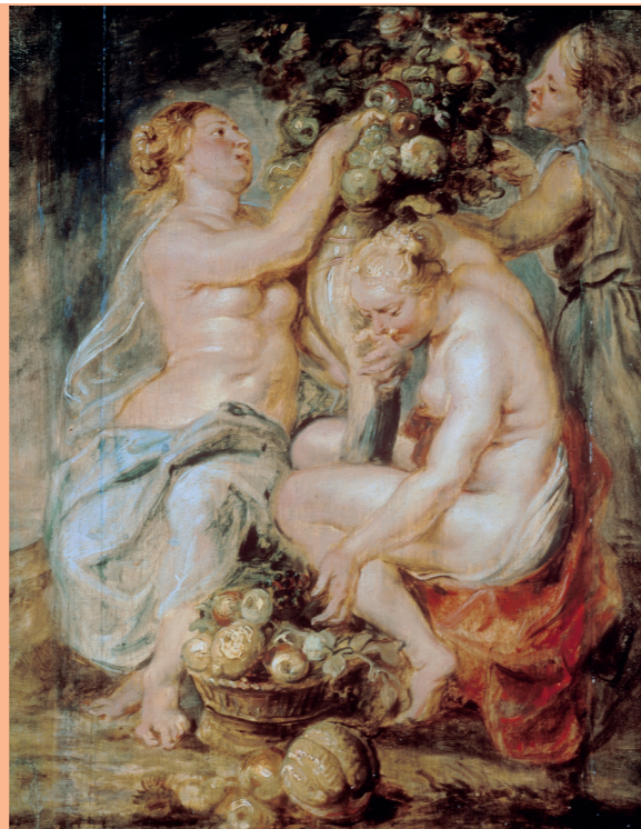
Peter Paul Rubens & Frans Snijders, Drie nimfen met de hoorn des overvloeds, Three Nymphs with the Horn of Plenty, c. 1625-1628, olieverf op doek, oil on panel. London, Dulwich Picture Gallery.

Gedurende de hele tentoonstellingsperiode zijn er iedere zaterdag en zondag en iedere doordeweekse dag in de herfstvakantie en kerstvakantie, tussen 12.00 en 15.00 uur performances in de tentoonstelling. Kijk voor het complete programma op boijmans.nl/rubens