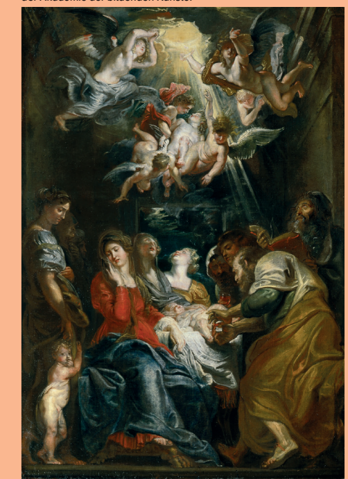
Peter Paul Rubens, De besnijdenis van Christus, The Circumcision of Christ, c.1604-05, olieverf op doek op paneel, oil on canvas mounted on panel. Wien, Gemäldegalerie der Akademie der bildenden Künste.

in Chicago, The J. Paul Getty Museum in Los Angeles, Museo Thyssen-Bornemisza in Madrid, The National Gallery in Londen en het Louvre in Parijs. De 68 olieverfschetsen tonen de enorme reikwijdte van Rubens 'meesterschap' en worden gecombineerd met een aantal van de grote schilderijen, prenten, voorbereidende tekeningen en een reusachtig tapijt van de meester.