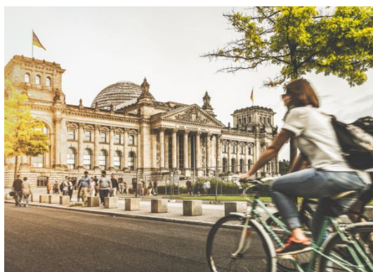
Durch Berlin radeln und mit der NH Hotel Group eine Gratisübernachtung sichern.

Berlin, 22. Mai 2017. Reiseziele mit dem Fahrrad zu entdecken liegt absolut im Trend. Die NH Hotel Group macht es jetzt auch für Berlin-Touristen ganz einfach, die deutsche Hauptstadt hautnah zu erfahren.