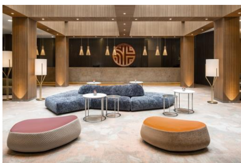
Zwischenstopp im neuen Premiumhotel NH Collection Berlin Mitte.