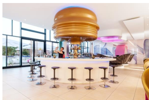
Im nhow Berlin erhalten Gäste mit einem BIKEATION-Pass 20 Prozent Rabatt auf Speisen und Getränke.