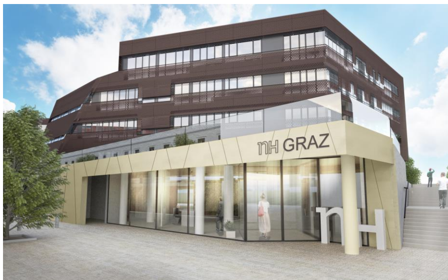
Am Karmeliterplatz entsteht das NH Graz, das 2018 eröffnen soll.