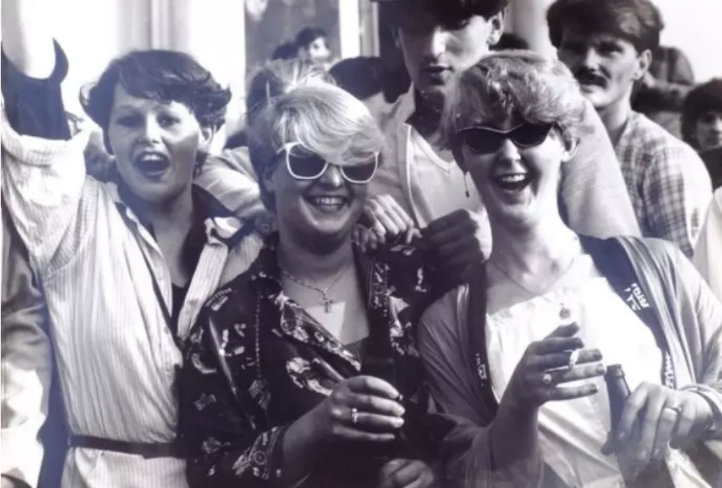
▲ Feesten in de Oostendse dancing Versailles in de jaren 70.

In het Huis van Alijn opent op zaterdag 4 juli de tentoonstelling 'C'est Party!', een overzicht van 100 jaar uitgaan in Vlaanderen en Brussel. De expo plaatst actuele vragen in een historisch perspectief en put daarvoor ook uit tal van privécollecties van iconen uit het uitgaansleven, zoals Bobby Setter en Charlotte de Witte.