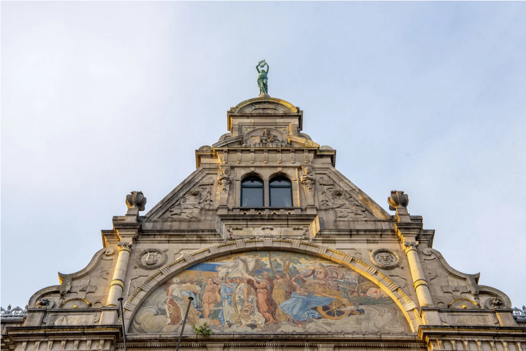
▲ De schouwburg op het Sint-Baafsplein

Er is een studiebureau aangesteld om een masterplan voor te bereiden voor de renovatie van de stadsschouwburg en Campo Victoria. Het studiebureau krijgt een jaar de tijd om te onderzoeken hoe beide locaties op een doordachte manier aangepakt en gerenoveerd kunnen worden.