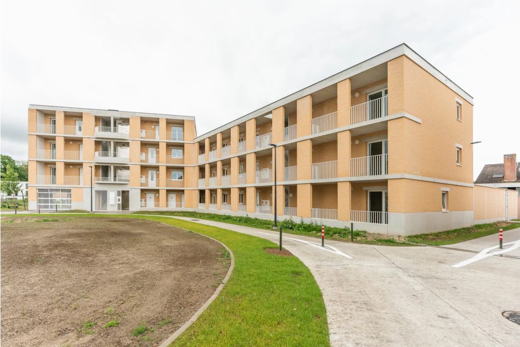
▲ De nieuwe sociale woningen in de Berkhoutsheide.

In Nieuw Gent hebben oude garageboxen plaatsgemaakt voor moderne sociale woningen. De Agaatstraat telt nu 36 nieuwe appartementen, even verderop in de Berkhoutsheide zijn er 23 nieuwe appartementen. Dankzij een nieuwe procedure ging het traject een pak sneller. Er zijn ook fietsenstallingen, openbaar groen en parkeerplaatsen bijgekomen.