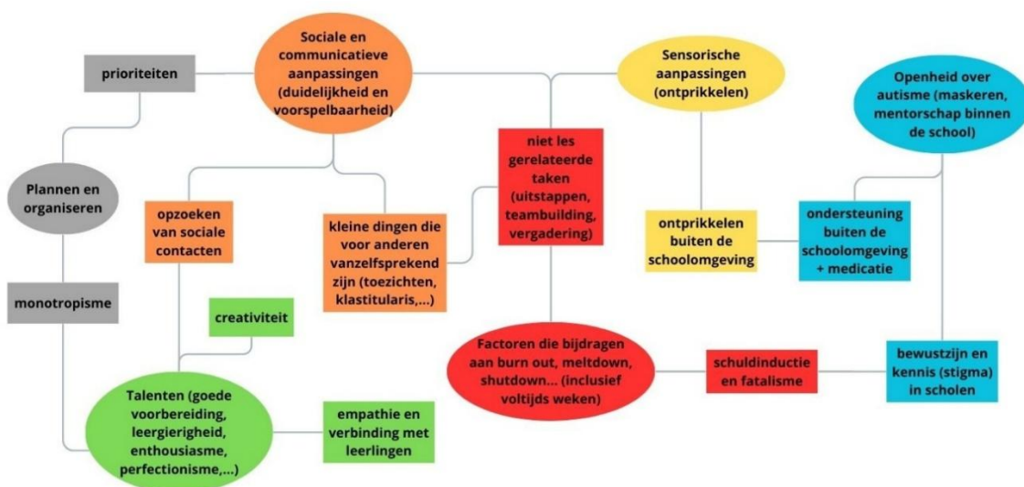
Figuur 3: Thematische analyse met 6 centrale thema's (ovalen) en 11 subthema's (rechthoeken)

Na het transcriberen van alle interviews wordt op basis van de gegenereerde thema's een coderingsinstructie opgesteld (zie Figuur 3). De thema's in deze coderingsinstructie komen grotendeels overeen met de thema's van de topic lijst (zie boven) maar de inhoudelijke invulling ervan wordt uitgebreid met subthema's die tijdens de transcripties van de interviews naar boven komen, dus aangebracht worden door de leerkrachten zelf. We kunnen daarom stellen dat de codering zowel data-driven als theory-driven is (Braun & Clarke, 2006). De coderingsinstructie hanteert 6 themakleuren (markeerstift) waarbij één of twee subthema-kleuren (onderlijnen) kunnen gecombineerd worden. Het coderen van de interviews gebeurt manueel en leidt niet meer tot nieuwe thema's, gezien dit werk reeds tijdens de transcripties van de interviews gebeurde. Wel stellen we bij het coderen snel een overlap van verschillende thema's vast (zie de lijnen tussen de thema's in Figuur 3). Na overleg met de promotor van dit onderzoek wordt beslist om de codering niet te vereenvoudigen en dit om geen inhoudelijk verlies te hebben (H. Roeyers, e-mail, 2 april 2025). De overlap wordt opgevangen door een dubbele codering aan sommige tekstgedeelten toe te kennen (in de kantlijn). De overeenkomstige coderingen worden dan telkens – over de 8 interviews heen - bij elkaar gelegd, rekening houdende met de overlap in thema's, om te komen tot onze resultaten.