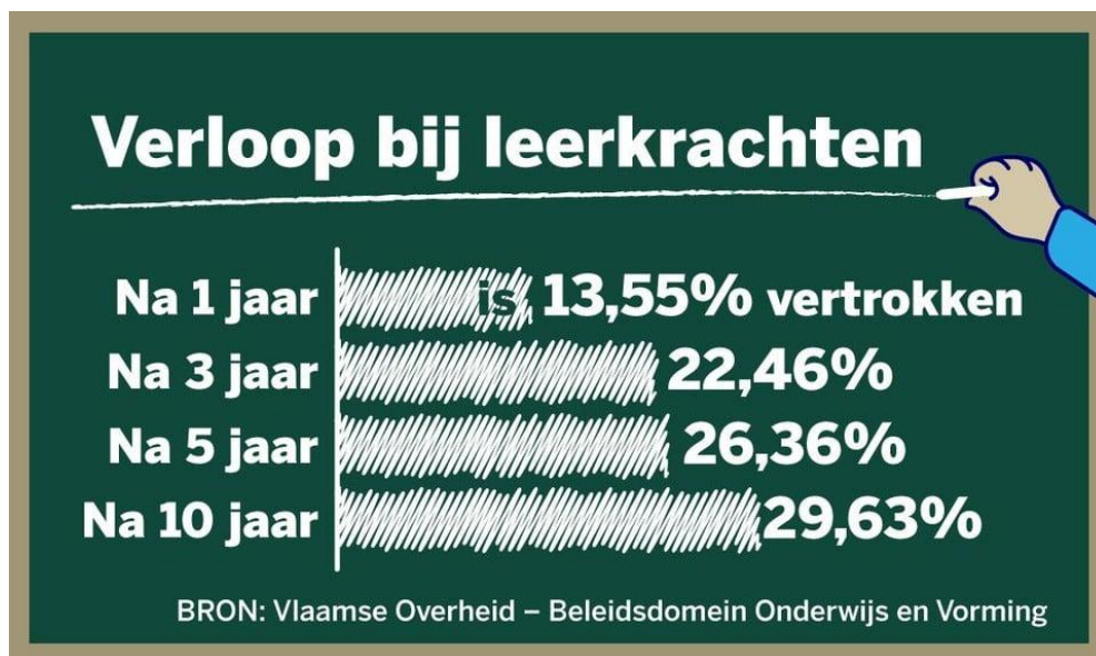
Figuur 1: Verloop bij leerkrachten in het Vlaamse onderwijs

Zoals geïllustreerd in Figuur 1 wordt het tekort groter doordat een kwart van de leerkrachten het onderwijs binnen de vijf jaar verlaat (Frederix & De Wilde, 2024; Nelisse, 2024). Vooral in het secundair onderwijs zijn de cijfers hoog: in het lager secundair onderwijs vertrekken 3 op de 10 leerkrachten, in het hoger secundair onderwijs verlaten 4 op de 10 leerkrachten het onderwijs (Nelisse, 2024), mede omdat hoogopgeleide leerkrachten ook elders op de arbeidsmarkt terecht kunnen (Frederix & De Wilde, 2024; Nelisse, 2024).