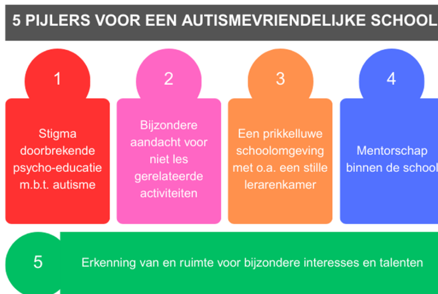
Figuur 4: Vijf pijlers voor een autismevriendelijke school

Deze interviewstudie toont dat luisteren naar leerkrachten met autisme waardevolle informatie oplevert. Vooreerst verwoorden de geïnterviewde leerkrachten dat er in scholen nog stereotiep gekeken wordt naar autisme en dat het stigma hieromtrent bij hen leidt tot gevoelens van schuld, schaamte en angst. Een stigma doorbrekende psycho-educatie omtrent autisme lijkt daarom een belangrijke start. Verder geven leerkrachten met autisme aan dat vooral niet les gerelateerde activiteiten moeilijk zijn en voor veel stress zorgen. Een bijzondere aandacht voor deze activiteiten is daarom aangewezen, liefst gekoppeld aan de interesses van de leerkrachten. De leerkrachten uit onze studie geven aan nood te hebben aan ontspanning en vragen naar een meer prikkelarme schoolomgeving waarin minstens één stille lerarenkamer aanwezig is. Daarenboven vragen zij dat mentorschap niet enkel geldt voor startende leraren maar structureel aanwezig blijft gedurende de ganse loopbaan als leerkracht. Tenslotte bevestigen onze leerkrachten dat zij empathisch en creatief zijn - in strijd met het stigma - en vragen zij erkenning van hun talenten waaronder o.a. monotropisme. Bovenstaande vatten we samen in Figuur 4: