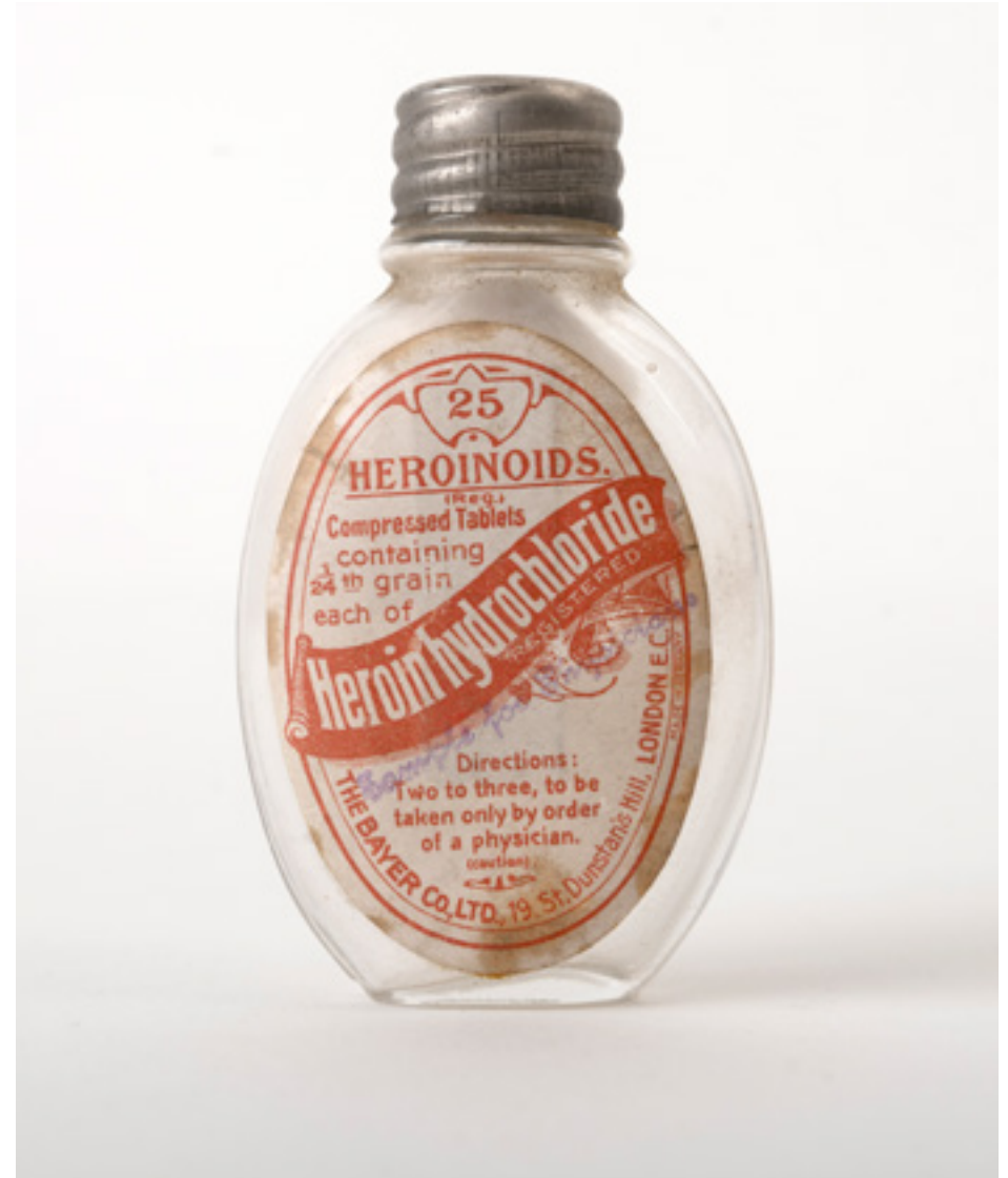
Chemiereus Bayer ziet rond 1900 de uitvinding van heroïne als haar kroonjuweel. Met vallen en opstaan leren wetenschappers, artsen en apothekers de werkzaamheid, bijwerkingen en de verslavingsrisico's van nieuwe stoffen kennen. Flesje dat diende als verkoopmonster voor heroïne hydrochloride, begin 20e eeuw.

Kritische kanttekeningen van onderzoekers, consumentenbonden en politici leiden niet meteen tot een kentering. Ondanks de hoge concentratie van nierpatiënten en het groeiende wetenschappelijke bewijs blijven de zogenaamde 'samengestelde pijnstillers' in België nog lange tijd vrij verkrijgbaar. De overheid en geneesmiddelencommissie reageren traag met verstrengde regels voor fabricage, reclame en verkoop. Farmabedrijven passen naderhand de formules van hun poeders aan. Steeds meer apothekers en huisartsen waarschuwen patiënten en klanten voor de risico's. Maar de winstgevendende productie en het hardnekkige dagelijkse gebruik laten zich niet gemakkelijk terugdringen.