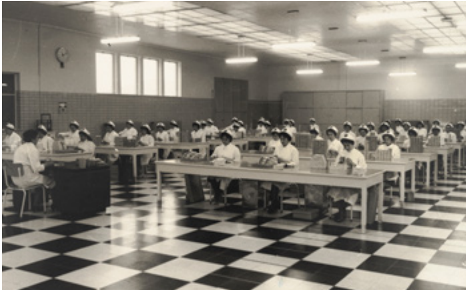
Foto van de verpakkingsafdeling van Laboratoria Tuypens aan de Parklaan in Sint-Niklaas, jaren 1960.

De opkomst van synthetische geneesmiddelen luidt een nieuw tijdperk in. Rond 1900 volgen de innovaties van chemisch-farmaceutische bedrijven elkaar in sneltempo op. Steeds meer lichamelijke en psychische kwalen krijgen een medische naam en een farmaceutische oplossing.