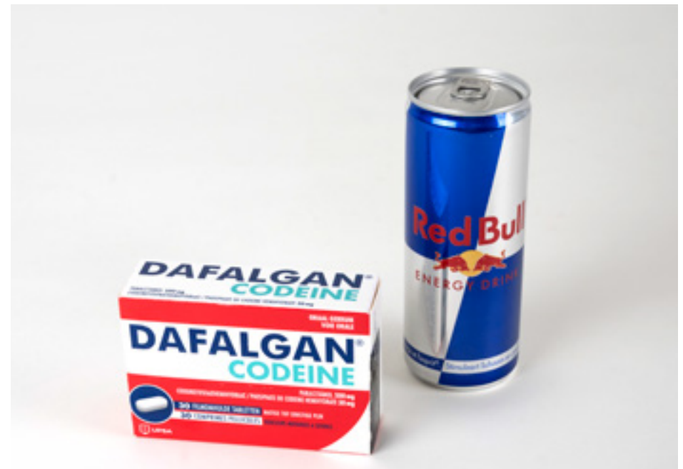
Hedendaagse verpakkingen van Dafalgan met codeïne en Red Bull.

is) in aanloop naar de expo de ruimte en vrijheid om een eigen traject op poten te zetten rond de zenuwpoeders van weleer. Gefascineerd door de voor die tijd typische, directe advertenties voor de poeders, stelden ze zich de vraag of ook zij er zelf door beïnvloed zouden zijn geweest. Met advies van de oudere generatie die de zenuwpoeders wél nog heeft gekend, timmerden ze een eigen reeks stories voor sociale media in elkaar die de poeders in de etalage plaatsen zoals dit vandaag met andere “gezondheidsstips” gebeurt. Hun verhaal en een logboek van het hele traject is te zien in de expo.