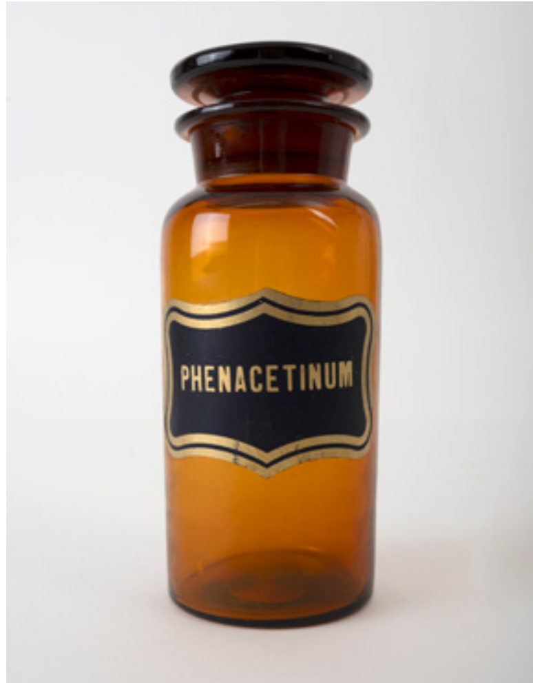
Glazen apothekerspot voor fenacetine, eerste helft 20e eeuw. Collectie Erfgoedhuis Zusters van Liefde JM

Fenacetine komt in 1887 op de markt als een van de eerste synthetische koortswerende pijnstillers. Lange tijd wordt fenacetine als schadelijke boosdoener van de zenuwpoeders beschouwd. Men sprak onder nierspecialisten en patiënten over 'fenacetine-nieren'.