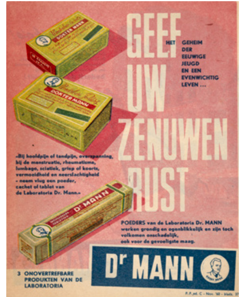
Reclamepamflet 'Geef uw zenuwen rust' van de Antwerpse firma Dr. Mann, ca. 1960.