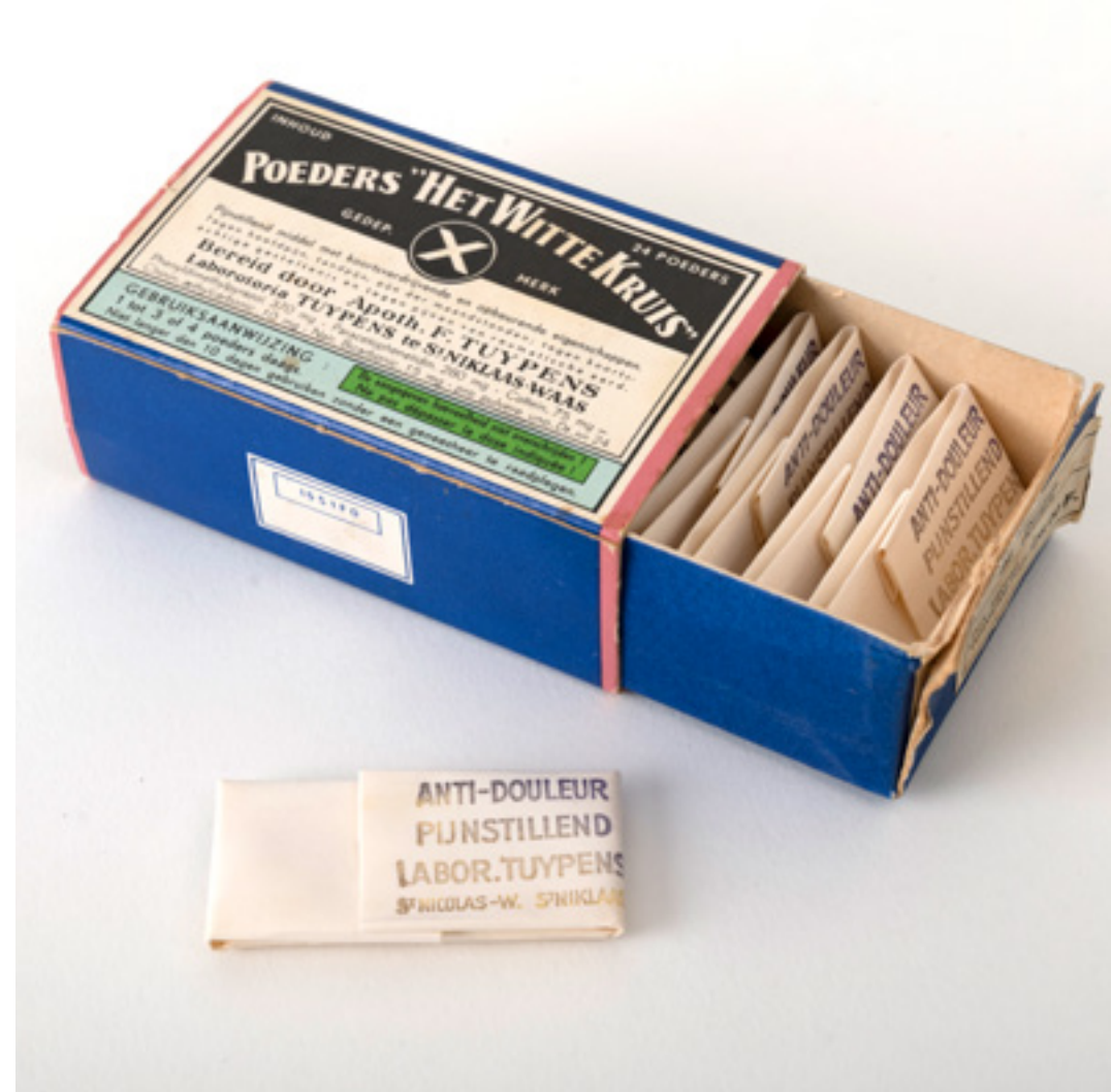
Doosje met 24 pijnstillende poeders 'Het Witte Kruis', jaren 1960–1980. Collectie Industriemuseum