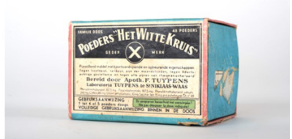
Poeders Het Witte Kruis, familie doos met 48 poederzakjes, ca. 1950–1960. Collectie Patrick Stockman

"Dat was de drugs van de mensen eigenlijk he. Als die dat niet hadden konden die niet leven hé. Ik opende een kleine kruidenier in de