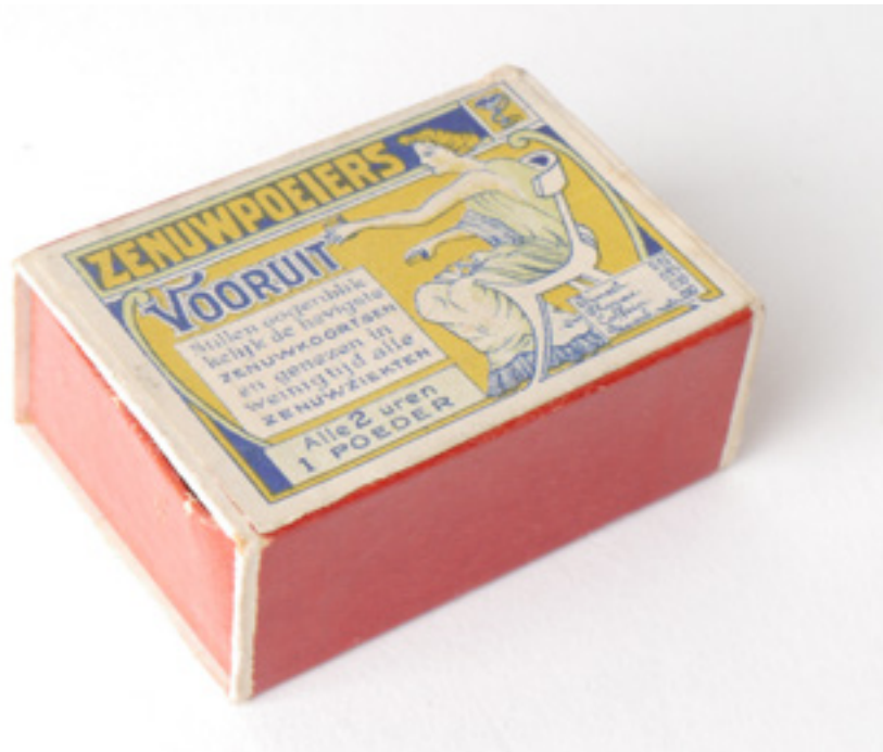
Zenuwpoeiers Vooruit met de veelzeggende gebruiksrichtlijn: ‘alle 2 uren 1 poeder’, ca. 1900–1920.