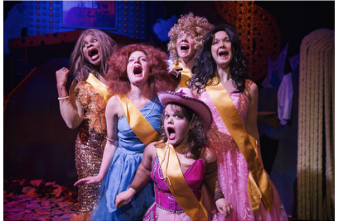
Toneelgroep Oostpool S17/18 Kinderen van Judas v01.