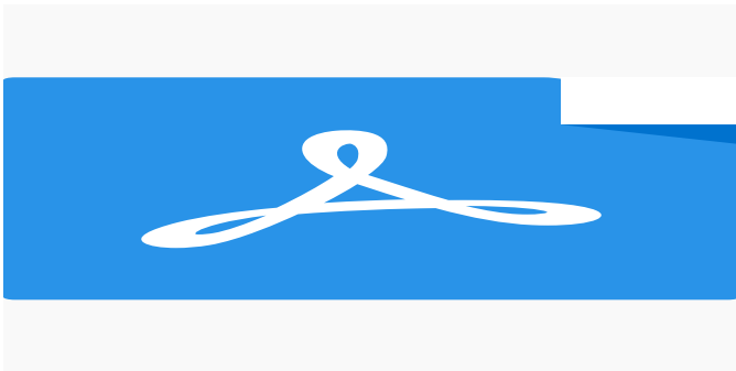
Visuel 1 - 40x60 - LD.pdf