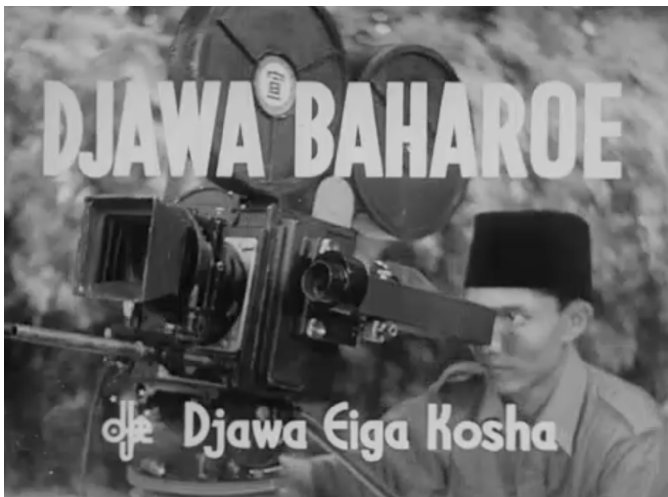
Still uit Djawa Baharoe (6) 1943, Djawa Eiga Kosha

Geconfisqueerd oorlogsmateriaal 75 jaar na bevrijding Nederlands-Indië online