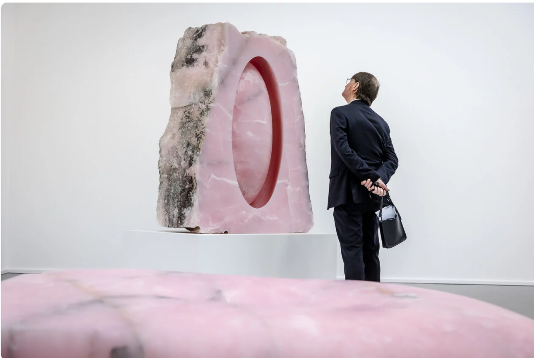
Anish Kapoor, Untitled, 2020 © VG Bild-Kunst, Bonn 2026, Foto: Anne Orthen