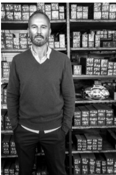
Erwin Wurm

Studio Erwin Wurm