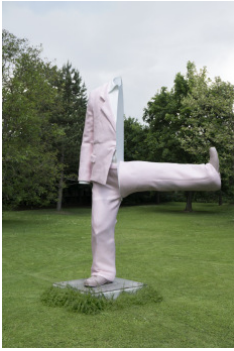
Erwin Wurm Halber Big Suit , 2016 Aluminiumguß lackiert 280 x 600 cm

Studio Erwin Wurm © VG Bild-Kunst, Bonn 2017 Foto: Studio Erwin Wurm