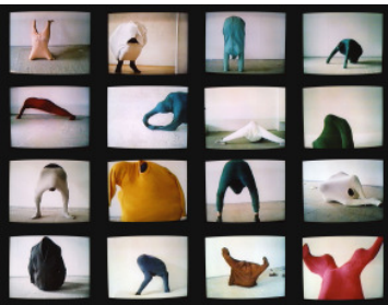
Erwin Wurm 59 Positions , 1992 Video

Studio Erwin Wurm © VG Bild-Kunst, Bonn 2017 Foto: Studio Erwin Wurm