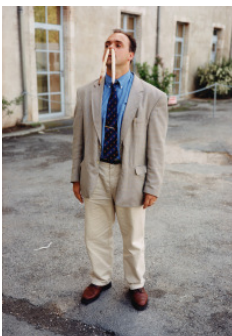
Erwin Wurm The bank manager in front of his bank , 1999 c-print 186 x 126,5 cm

Studio Erwin Wurm © VG Bild-Kunst, Bonn 2017 Foto: Studio Erwin Wurm