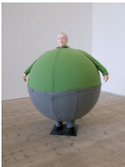
Erwin Wurm The Artist who Swallowed the World , 2006 Mischtechnik 190 x 140 x 140 cm

Sammlung Sanziany & Palais Rasumofsky, Wien © VG Bild-Kunst, Bonn 2017