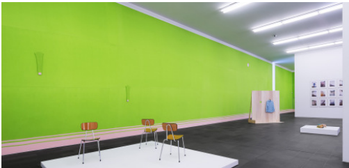
Erwin Wurm Installationsansicht MKM, 2017

Die honorarfreie Veröffentlichung ist nur gestattet im Zusammenhang mit der Berichterstattung über die Ausstellung. Bitte beachten Sie die Creditangaben/Fotografen. Die Thumbnails sind nicht farbverbindlich.