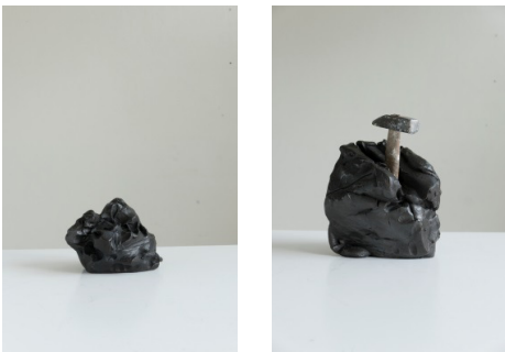
Erwin Wurm Land der Berge, 2017 Bronze, 55-teilig links: Berg 20, Bronze, patiniert, 16 x 19 x 19 cm rechts.: Berg 23, Bronze, patiniert, Hammer, 28 x 28 x 23 cm

© VG Bild-Kunst, Bonn 2017