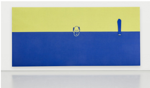
Erwin Wurm Wandpullover , 2016 Wolle 280 x 600 cm

Studio Erwin Wurm © VG Bild-Kunst, Bonn 2017