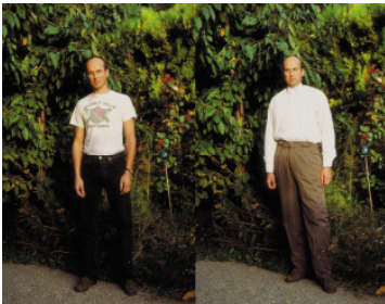
Erwin Wurm Me / Me Fat , 1993 c-print 180 x 230 cm, 2-teilig

Studio Erwin Wurm © VG Bild-Kunst, Bonn 2017 Foto: Studio Erwin Wurm