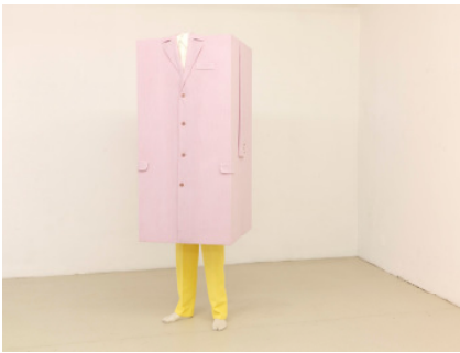
Erwin Wurm Kastenmann rosa-gelb , 2008-2009 Gips, MDF, Wolle 220 x 70 x 70 cm

Sammlung Sanziany & Palais Rasumofsky, Wien