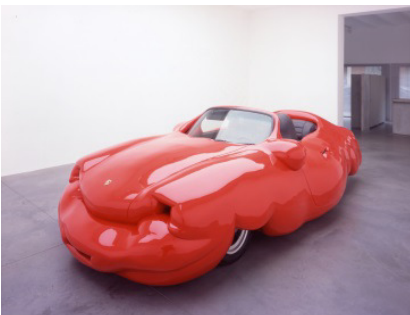
Erwin Wurm Fat Convertible , 2005 Mischtechnik 130 x 469 x 239 cm

Studio Erwin Wurm © VG Bild-Kunst, Bonn 2017