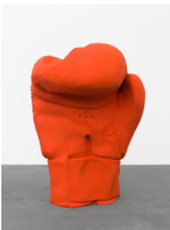
Erwin Wurm Boxhandschuh, 2016 Bronzeguß patiniert 146 x 112 x 96 cm

Studio Erwin Wurm © VG Bild-Kunst, Bonn 2017 Foto: Studio Erwin Wurm