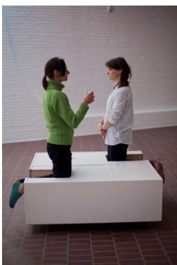
Erwin Wurm Reinigungsmöbel zur Läuterung , 2011 Holz, Metall, Farbe 52 x 125 x 120 cm Installationsansicht, Middelheim Museum, Antwerpen, 2011

Studio Erwin Wurm © VG Bild-Kunst, Bonn 2017 (Gehört zur Reihe der Drinking Sculptures)