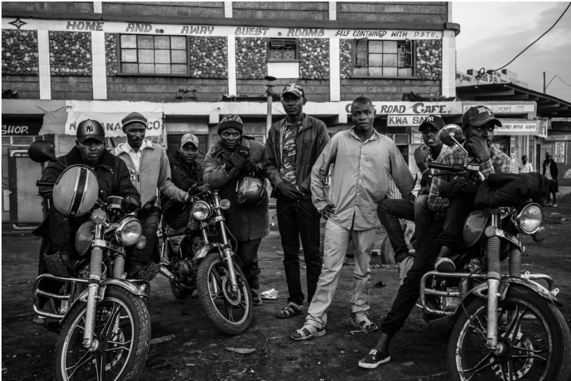
Over David Yarrow